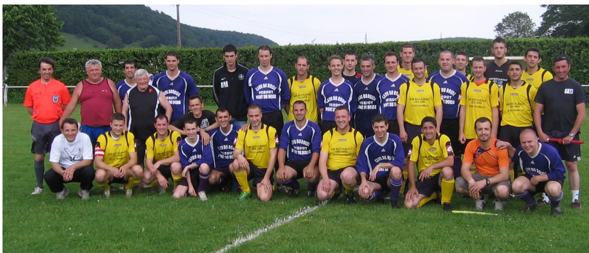
Avec les adversaires de la dernière journée de championnat

L'équipe B termine également première et accède en division supérieure. De plus cette équipe a remporté la coupe « PONS SPORT ».