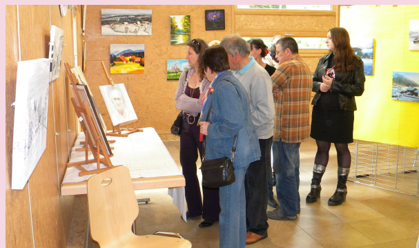
Un public très attentif