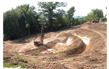
mise en forme des bassins