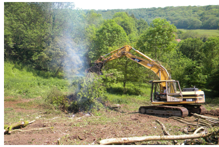
pendant le défrichage