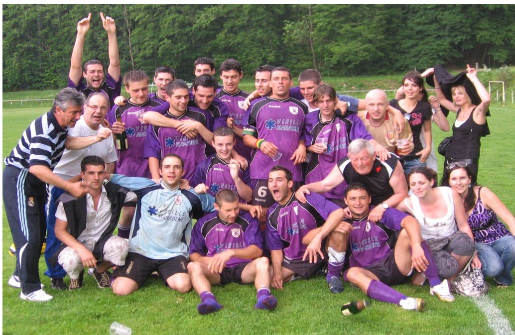
La joie de la montée

L'équipe A termine première de son groupe et monte en division supérieure.