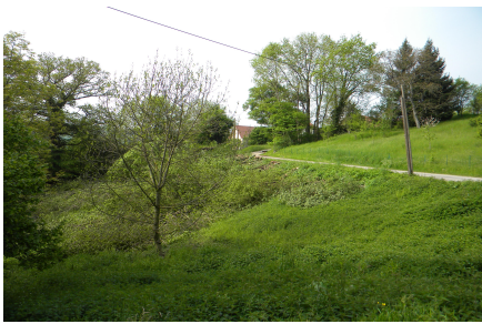
La combe avant travaux