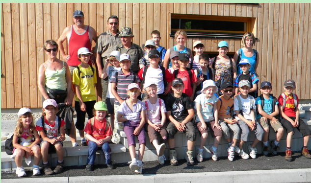
Au moment du départ

Les enfants de l'école d'Autechaux, ont participé à une journée placée sous le signe de la nature. Les chasseurs de l'association locale, ont fait découvrir le matin, la nature aux enfants. Les arbres, Les insectes, les fleurs, les traces d'animaux, etc... Le repas de midi a été pris dans le parc de Mr MORIN. Découverte des animaux de la ferme, lapins, moutons, anes, les oiseaux, canards, oies observation également des poissons peuplant l'étang. Une nichée de chiots ont même pu être observée. Tous les enfants ont apprécié cette journée. Merci à tous les bénévoles accompagnateurs de cette belle journée.